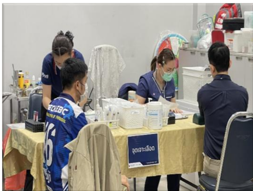
รูปที่ 2-1 การตรวจสอบสภาพพนักงานประจำปี