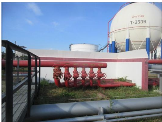
รูปที่ 2-39 วาล์วน้ำหล่อเย็นแบบเปิดด้วยมือ (Manual valve)