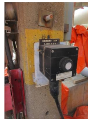
รูปที่ 2-32 ระบบหยุดสุบถ่ายฉุกเฉินทั้งระบบ บริเวณถังจัดเก็บ