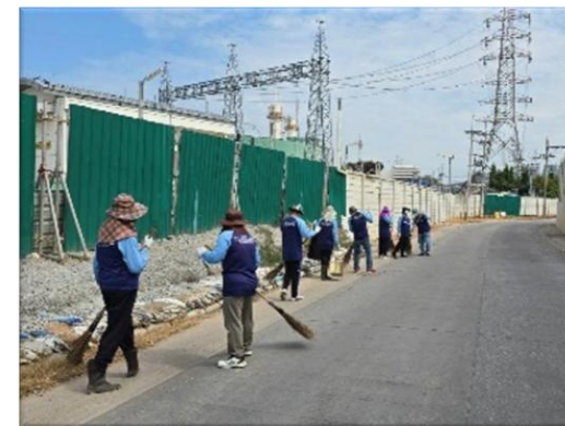
รูปที่ 2-15 โครงการสนับสนุนและพัฒนาด้านสิ่งแวดล้อม