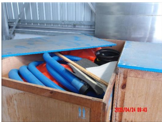
รูปที่ 2-6 (ต่อ) อุปกรณ์จัดคราบน้ำมันพร้อมใช้งาน