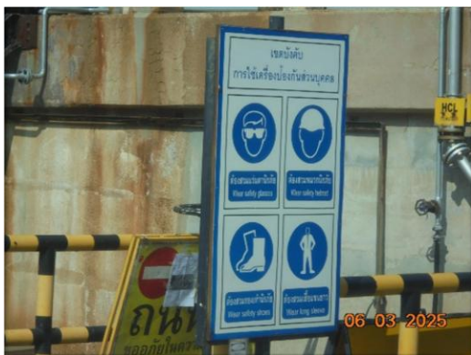
รูปที่ 2-18 ป้ายเตือนสวมใส่อุปกรณ์ป้องกันอันตรายส่วนบุคคล