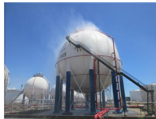
รูปที่ 2-38 ระบบน้ำฝอยหล่อเย็น (water spray system)