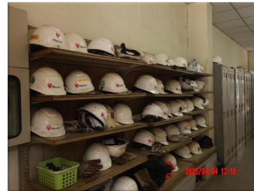
รูปที่ 2-22 พื้นที่สำหรับจัดเก็บอุปกรณ์ป้องกันอันตรายส่วนบุคคล