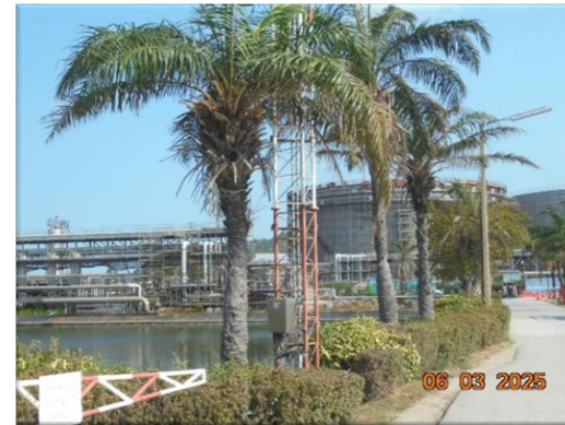
รูปที่ 2-48 จัดให้มีพื้นที่สีเขียว