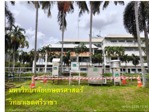
รูปที่ 2-49 กิจกรรมที่เกิดขึ้นโดยรอบจุดตรวจวัดคุณภาพอากาศ