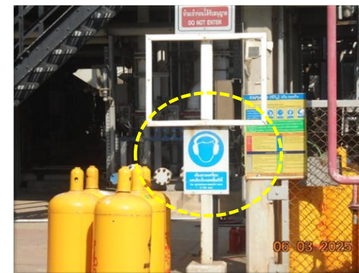
รูปที่ 2-4 การควบคุมการใช้เครื่องป้องกันเสียง ในพื้นที่ที่มีระดับเสียงเกิน 85 เดซิเบล(เอ)