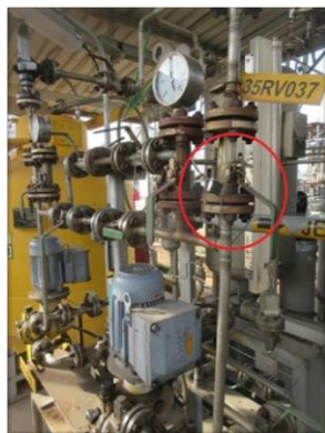
รูปที่ 2-35 Lock-out Mercaptan Injection Pump