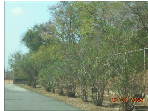
รูปที่ 2-48 (ต่อ) จัดให้มีพื้นที่สีเขียว