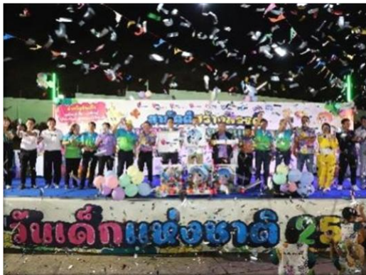
รูปที่ 2-12 (ต่อ) โครงการสนับสนุนและพัฒนาชุมชนด้านต่าง ๆ