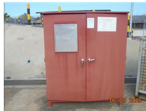
รูปที่ 2-46 อุปกรณ์ป้องกันอัคคีภัย