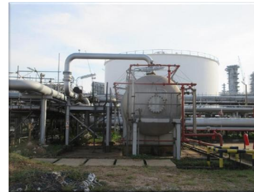
รูปที่ 2-30 ระบบควบคุมการสุบกักลับกรณีเกิดการรั่วไหล