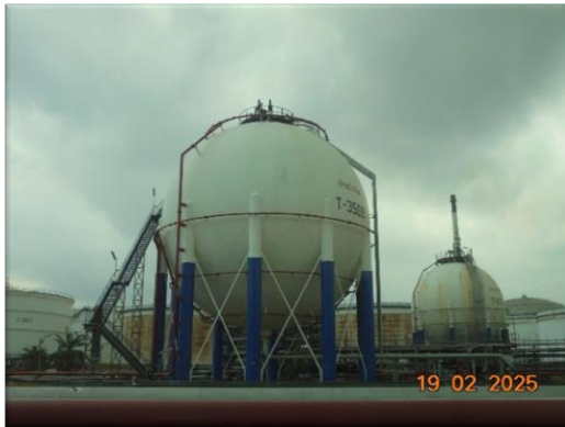
รูปที่ 2-27 ถังเก็บกากปิโตรเลียมเหลว