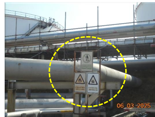
รูปที่ 2-19 รูปป้ายเตือนอันตรายในพื้นที่