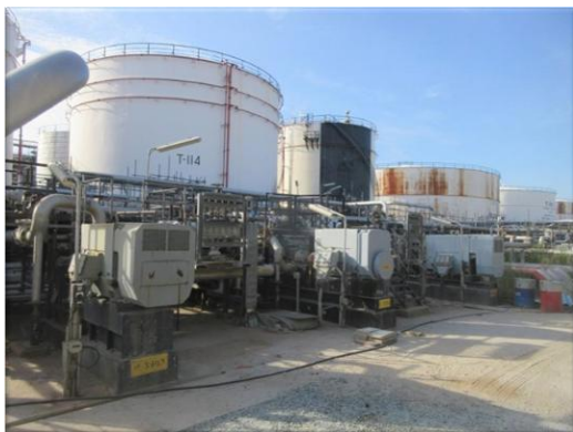
รูปที่ 2-31 ระบบปั๊มสุบถ่ายความดันสูง