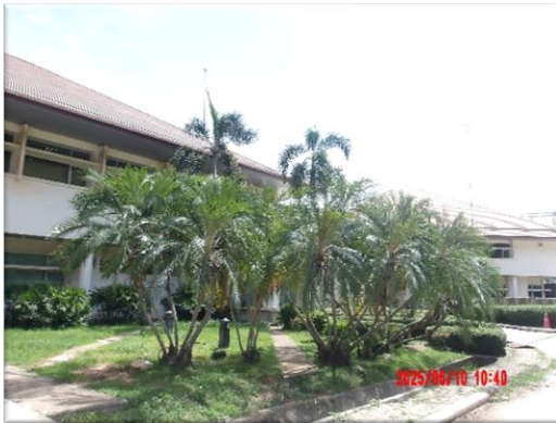
รูปที่ 2-48 (ต่อ) จัดให้มีพื้นที่สีเขียว