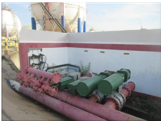
รูปที่ 2-37 วาล์วน้ำหล่อเย็นแบบเปิดอัตโนมัติเมื่อไฟไหม้ (Deluge valve system)