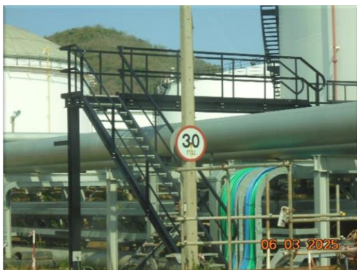
รูปที่ 2-45 ติดตั้งป้ายจำกัดความเร็วรถยนต์บริเวณเข้า-ออก และภายในพื้นที่โรงกลั่น