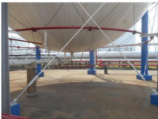
รูปที่ 2-25 Fire Detector (Plastic Tube)