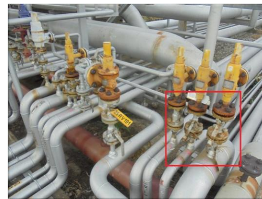
รูปที่ 2-34 ระบบ Manual and Keypad Control (Log Out Tag Out)