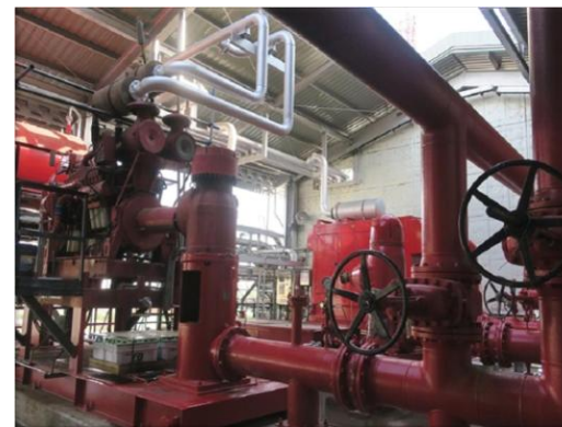
รูปที่ 2-44 บั๊มน้ำดับเพลิง