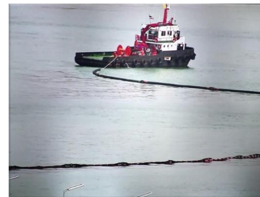
รูปที่ 2-7 การฝึกซ้อมแผนปฏิบัติการกรณีน้ำมันหกลงทะเล