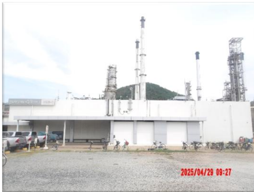
รูปที่ 2-21 ห้องควบคุม (Control Room)