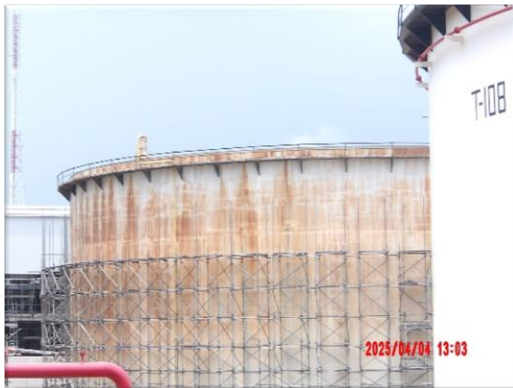
รูปที่ 2-8 ถัง Slop สำหรับเก็บน้ำมันดิบ