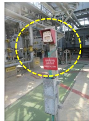
รูปที่ 2-36 จุดแจ้งเหตุเพลิงไหม้ ประจำพื้นที่ถังเก็บ