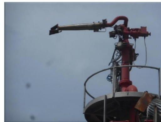
รูปที่ 2-40 หัวฉีดน้ำและโฟมดับเพลิงระยะไกล