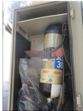
รูปที่ 2-47 อุปกรณ์ SCBA