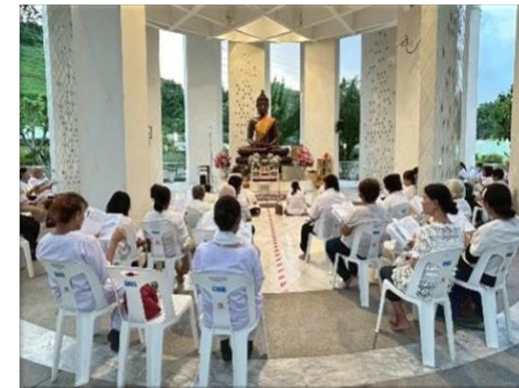
รูปที่ 2-13 โครงการที่สนับสนุนกิจกรรมทางศาสนา สังคม และวัฒนธรรม