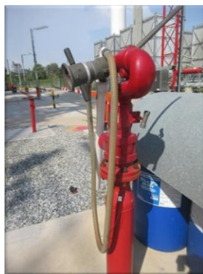
รูปที่ 2-41 หัวฉีดน้ำดับเพลิงชนิดประจำพื้นที่ (Deluge valve system)