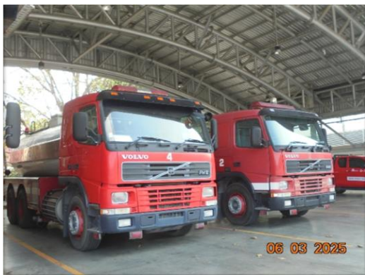
รูปที่ 2-43 อุปกรณ์ดับเพลิงชนิดเคลื่อนย้าย เช่น รถดับเพลิงหัวฉีดน้ำดับเพลิง โฟม