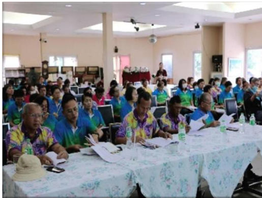
รูปที่ 2-11 (ต่อ) การประชาสัมพันธ์ข้อมูลข่าวสารโครงการฯ