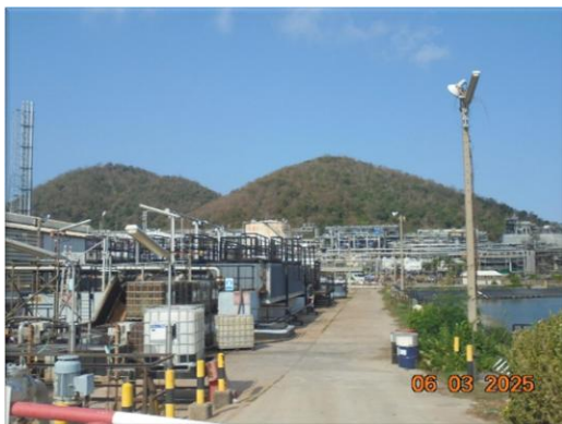
รูปที่ 2-5 หน่วยบำบัดน้ำก่อนระบายออกนอกโรงงาน