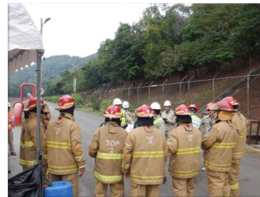
รูปที่ 2-17 การฝึกซ้อมและทบทวนแผนป้องกันและระงับอัคคีภัยประจำปี