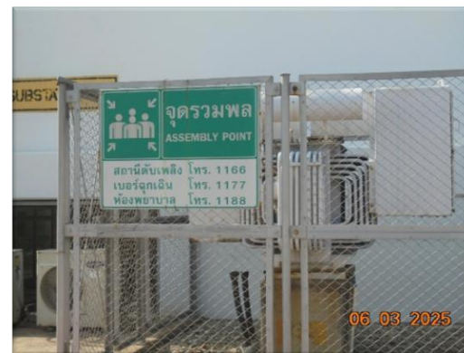
รูปที่ 2-26 จุดรวมพล