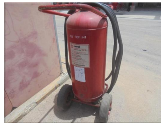
รูปที่ 2-42 อุปกรณ์ดับเพลิงชนิดมือถือชนิดผงเคมีแห้ง