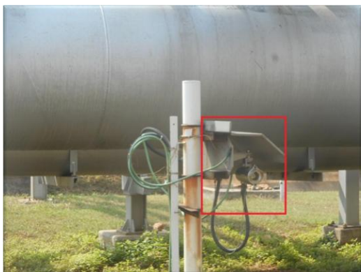
รูปที่ 2-23 อุปกรณ์ตรวจจับสารไวไฟรั่วระยะเหวแบบลำแสง