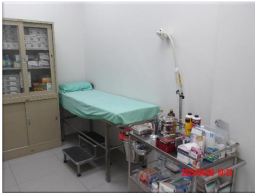
รูปที่ 2-20 ชุดปฐมพยาบาลเบื้องต้นและห้องพยาบาล