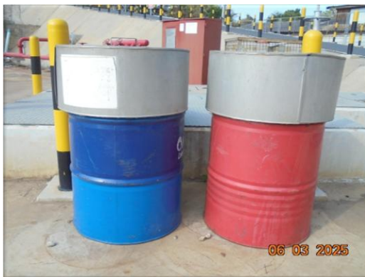
รูปที่ 2-10 ภาชนะรองรับขยะมูลฝอยที่มีฝาปิดมิดชิด