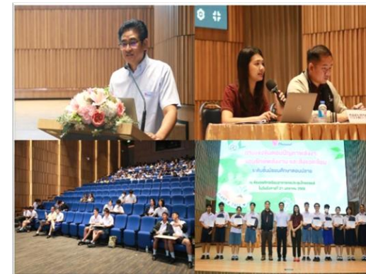
รูปที่ 2-14 โครงการที่สนับสนุนกิจกรรมด้านการศึกษา