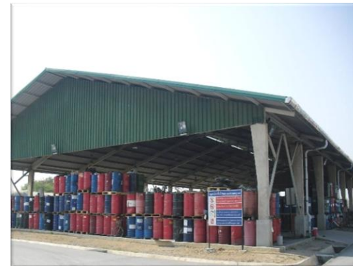
รูปที่ 2-9 พื้นที่สำหรับจัดเก็บกากของเสีย