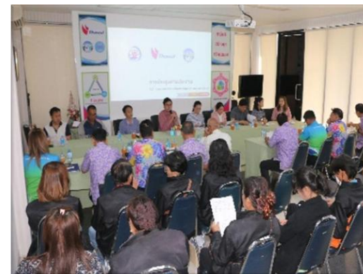
รูปที่ 2-11 การประชาสัมพันธ์ข้อมูลข่าวสารโครงการฯ