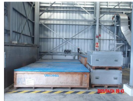
รูปที่ 2-6 อุปกรณ์จัดคราบน้ำมันพร้อมใช้งาน