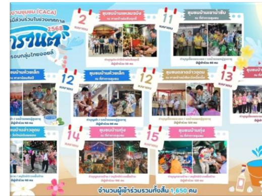
รูปที่ 2-12 โครงการสนับสนุนและพัฒนาชุมชนด้านต่าง ๆ