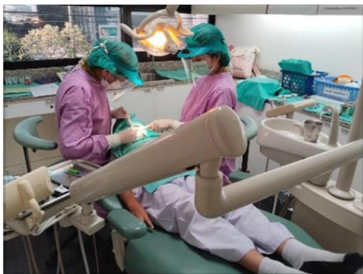
รูปที่ 2-16 หน่วยสาธารณสุขเคลื่อนที่เพื่อให้บริการด้านการตรวจสุขภาพ