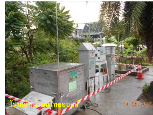
รูปที่ 2-49 (ต่อ) กิจกรรมที่เกิดขึ้นโดยรอบจุดตรวจวัดคุณภาพอากาศ