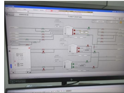
รูปที่ 2-28 สัญญาณเตือนของอุณหภูมิและความดันของถังเก็บกาก