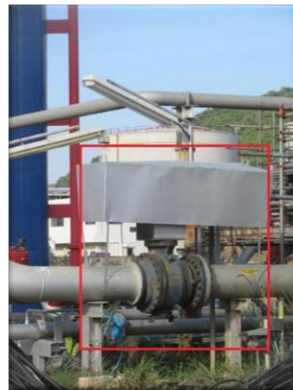
รูปที่ 2-29 วาล์วปิดทางออกฉุกเฉินสำหรับถังเก็บกากปิโตรเลียมเหลว