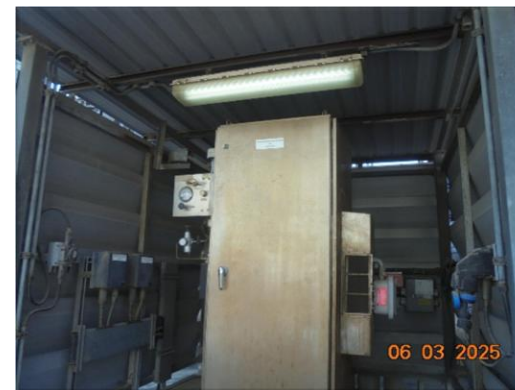
รูปที่ 2-2 ระบบตรวจสอบคุณภาพอากาศแบบต่อเนื่อง (CEMS)