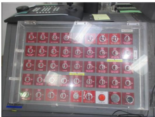
รูปที่ 2-33 ระบบหยุดสุบถ่ายฉุกเฉินทั้งระบบ บริเวณห้องควบคุม